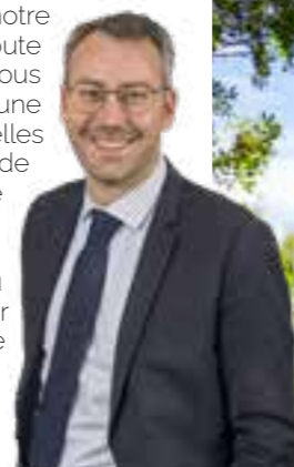
Maxence de Rugy Président de Vendée Grand Littoral

Je vous souhaite de belles explorations estivales ainsi que de belles vacances en Vendée Grand Littoral !