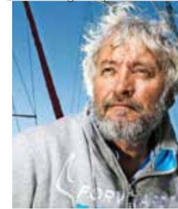
Yvan Bourgnon, parrain de la course