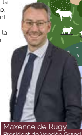
Maxence de Rugy Président de Vendée Grand Littoral

En effet, si la transition écologique vient répondre à des enjeux environnementaux forts, cette transition est aussi l'occasion de nous interroger sur notre mode de vie. Privilégier les produits locaux, préférer les modes de déplacements doux, alléger sa poubelle, réaliser des travaux d'économies d'énergie... toutes ces actions prouvent que nous avons tous à gagner à partager un mode de vie plus durable.