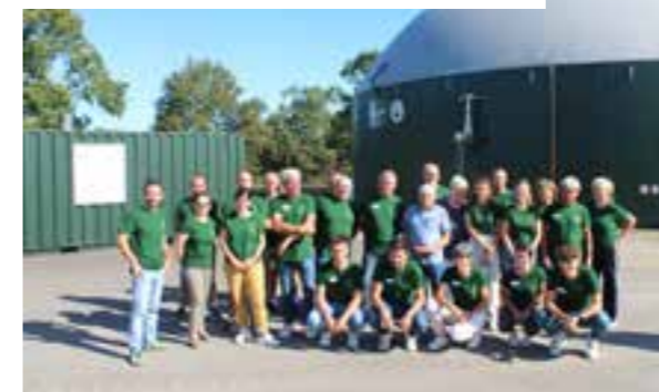
A Grosbreuil, l'équipe du GAEC la Gachetière a ouvert la première unité de méthanisation en Vendée Grand Littoral.

Les six exploitants du GAEC la Gachetière se sont lancés dans l'aventure en 2019. Une façon de contribuer à relever le défi de la transition écologique et aussi de faire perdurer leur production et pérenniser leur exploitation. Pari réussi ! Aujourd'hui, le site produit l'équivalent de la consommation annuelle de 1 800 logements neufs chauffés au gaz.