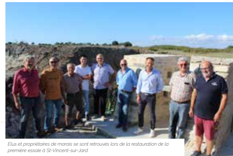
Elus et propriétaires de marais se sont retrouvés lors de la restauration de la première essaie à St-Vincent-sur-Jard.