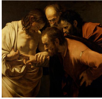
L'incrédulité de Saint-Thomas Le Caravage, 1601. Palais de Sanssouci, Potsdam (Allemagne)