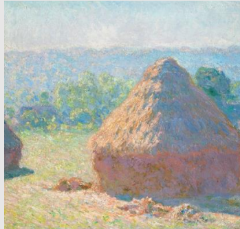
Meules, fin de l'été Claude MONET, 1891. Musée d'Orsay, Paris