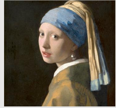
La jeune fille à la perle Johannes VERMEER, 1665. Mauritshuis, La Haye (Pays-Bas)