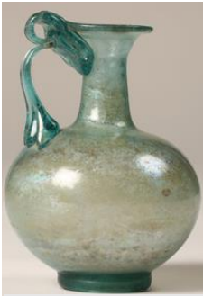
Cruche en verre, Ier-IIIème siècle. Forum Antique de Bavay (59)

Gâteaux, jus de fruits et découverte d'une œuvre sur le thème culinaire. Miam !