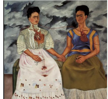
Les deux Fridas Frida KAHLO, 1939. Musée d'Art Moderne, Mexico (Mexique)