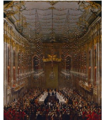
Souper dans la salle de la Redoute, Martin VAN MEYENS et son studio, 1760/63. Château de Schönbrunn, Vienne (Autriche)

Laissez-vous éblouir par les décors fastueux de noces royales entre la dynastie des Habsbourg et le Royaume de France. D'après les tableaux conservés au château de Schönbrunn à Vienne.