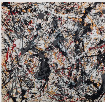
Painting (silver over black, white, yellow and red) Jackson Pollock, 1948. Centre Pompidou, Paris