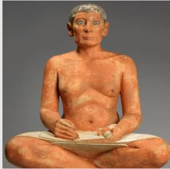
Le scribe accroupi 2600-2350 avt J.-C. Musée du Louvre, Paris

Décryptage d'une œuvre célèbre de l'Histoire de l'Art.