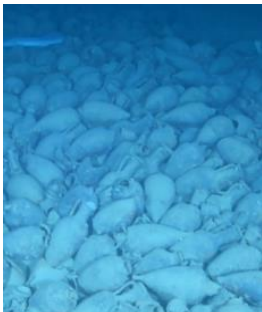
Epave antique Capo Sagro 3.