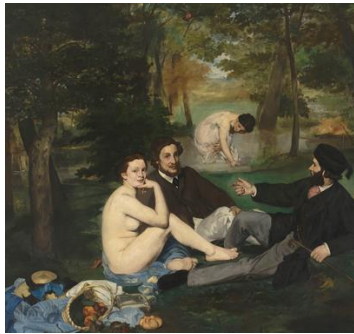
Le déjeuner sur l'herbe Edouard MANET, 1863. Musée d'Orsay, Paris